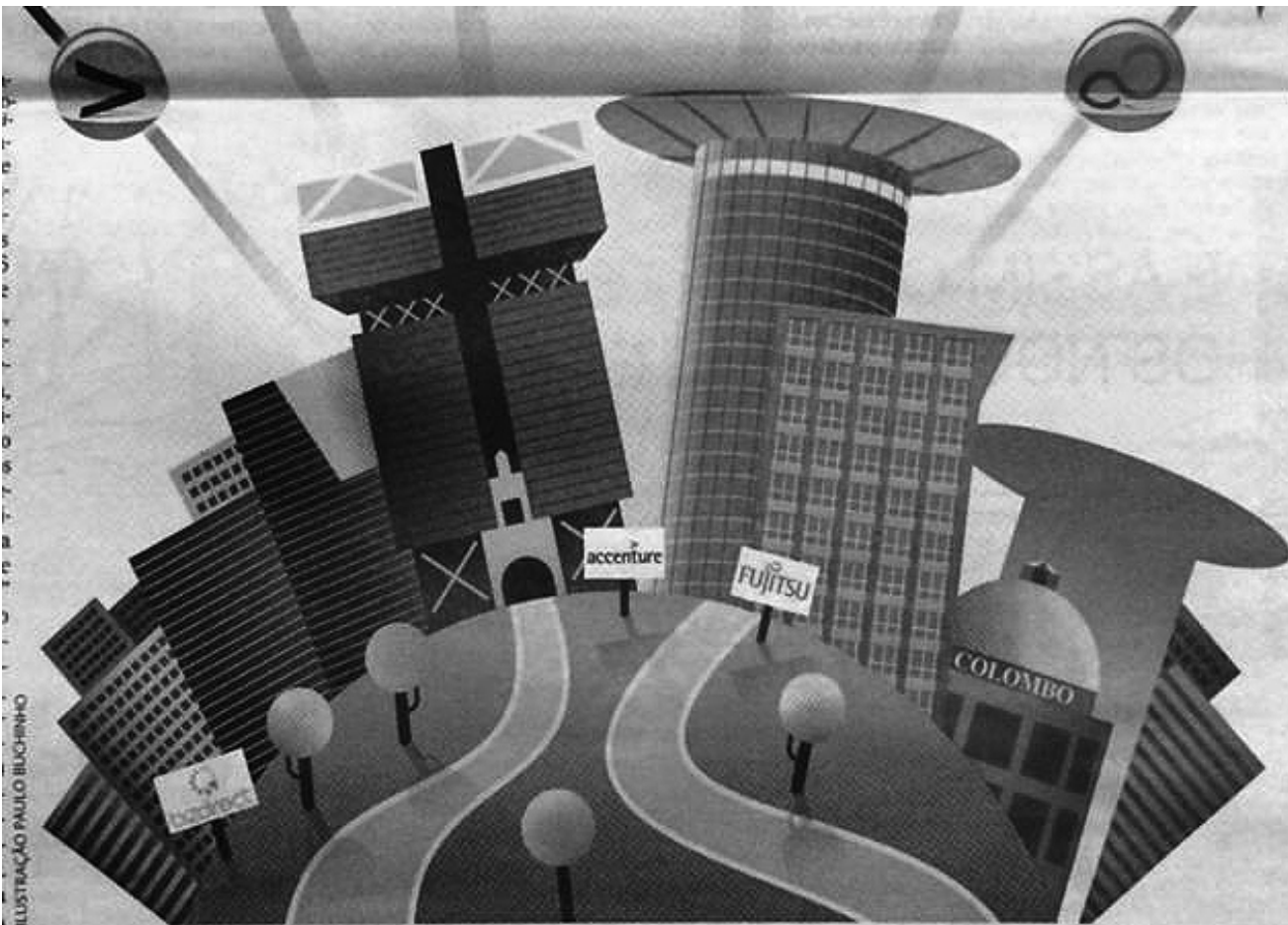
ILUSTRAÇÃO PAULO BILCHINHO