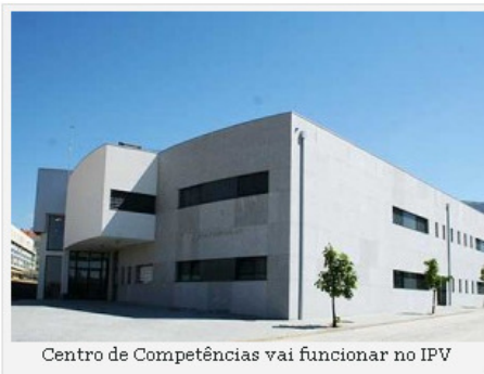
Centro de Competências vai funcionar no IPV

O Município de Viseu, o Instituto Politécnico de Viseu e a Bizdirect, empresa tecnológica do universo SSI / Sonaecom especializada na comercialização de soluções de IT, na consultoria e gestão de contratos corporativos de licenciamento e na integração de soluções Microsoft, assinam hoje o protocolo para a criação do Centro de Competências dedicado à prestação de serviços inovadoras e de qualidade em tecnologia Microsoft (Dynamics CRM, SharePoint e BizTalk), direccionado para o mercado internacional, que será instalado no campus do Instituto Politécnico de Viseu.