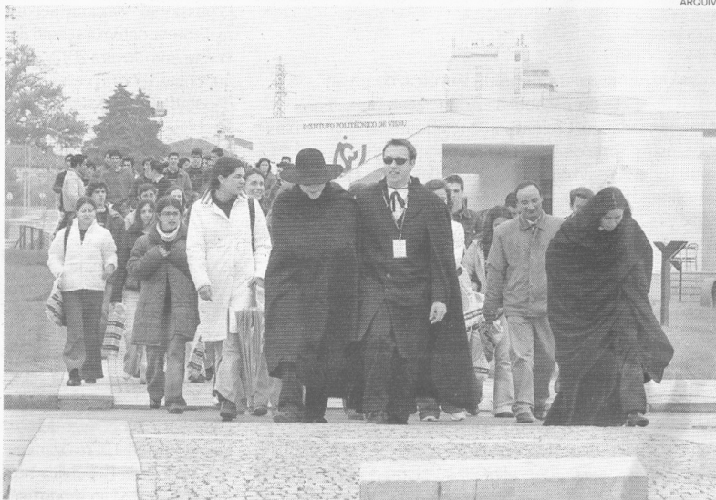
Diplomados do Instituto Politécnico de Viseu terão prioridade no processo de recrutamento

“Vai ser dada prioridade aos nossos estudantes de informática e gestão de empresas, e a seguir aos residentes em Viseu, mesmo que não tenham estudado no Politécnico”, adiantou.